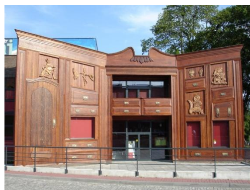
Zdjęcie 1: Budynek teatru Baj Pomorski

Teatr „Baj Pomorski” 7 to miejska instytucja kultury prowadzona przez gminę miasta Toruń. Zlokalizowany na obrzeżach Starego Miasta budynek teatru przyciąga ciekawą architekturą (obiekt zmodernizowany w ramach ZPORR 2004-2006). Teatr realizuje szereg projektów o znaczeniu kulturalnym i społecznym skierowanych głównie do dzieci i młodzieży z obszaru centrum Miasta.