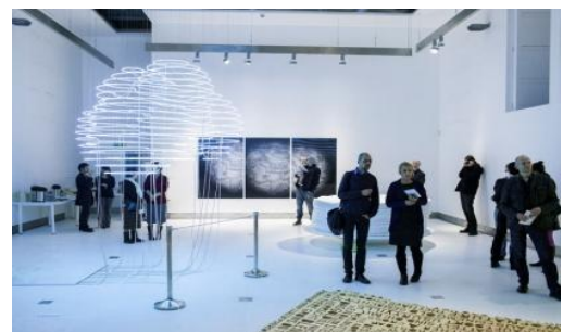
Zdjęcie 2: CSW Łażnia

Centrum Sztuki Współczesnej Łażnia 8 to jedna z pierwszych publicznych instytucji kultury utworzona w Polsce po przełomie w 1989 roku, uchwałą Rady Miasta Gdańska. Jest to przykład instytucji, która efekty pracy edukacyjnej osiągnęła dzięki wieloletniej pracy w oparciu o niekonwencjonalne działania w sferze kultury, inicjowane oddolnie przez animatorów wywodzących się ze środowiska artystów. Jest to przykład na to, jak sztuka może zostać wykorzystana w celach rewitalizacji społecznej.