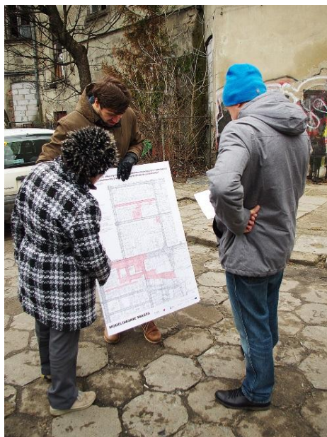
Foto: Promocja konkursu za pomocą plakatów i ulotek.