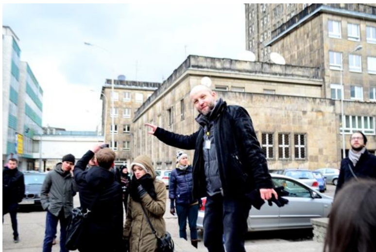
Foto: Przed gmachem telewizji.