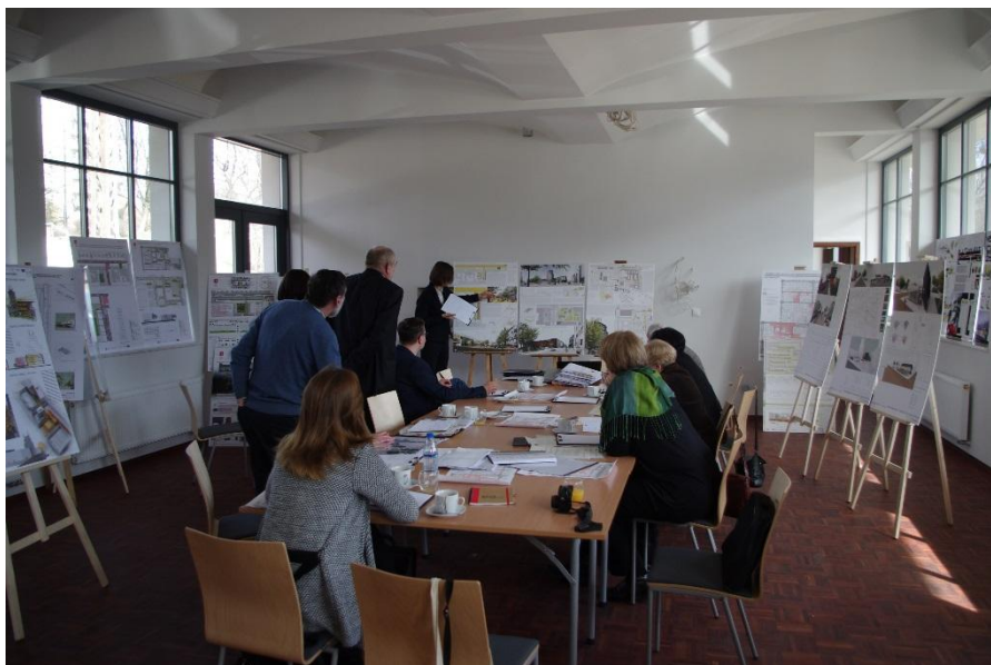
Foto: Analiza merytoryczna prac konkursowych.