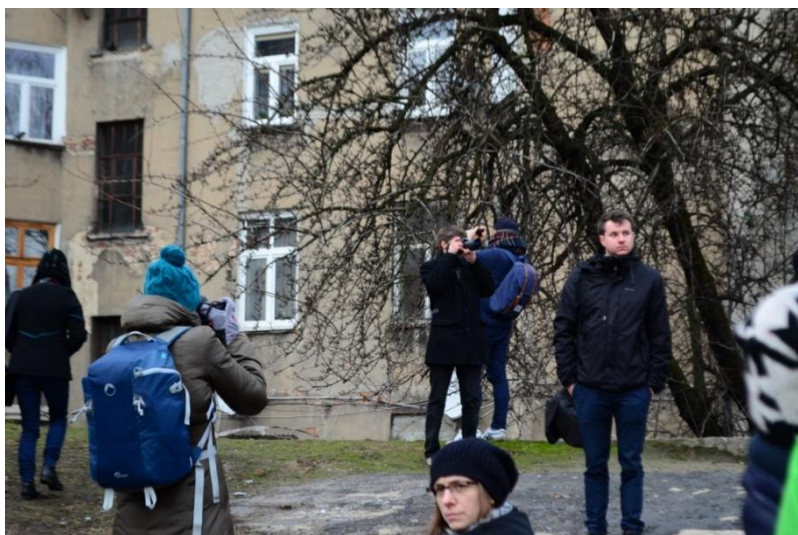
Foto: Projektanci w obszarach objętych konkursem.