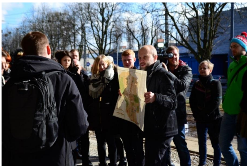
Foto: Rozpoczęcie spaceru z przewodnikiem.

Tego samego dnia przedstawiciele zespołów projektowych uczestniczyli w trzygodzinnym spacerze z przewodnikiem, który zaprezentował historię rozwoju obszaru objętego konkursem. Pokazał specyfikę społeczną obszarów.