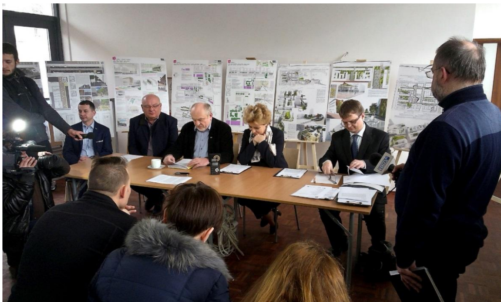
Foto: Publiczne ogłoszenie wyników konkursu