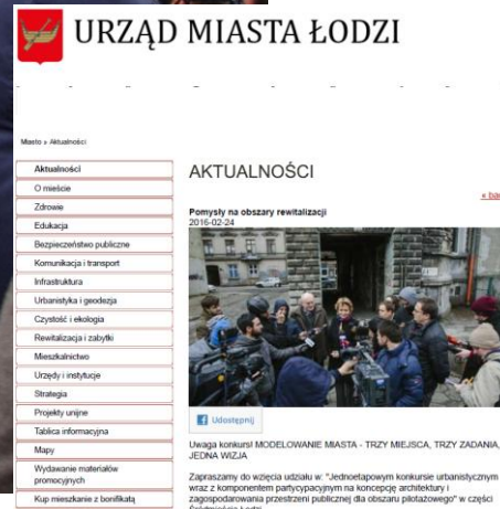
Foto: Konferencja prasowa poprzedzająca ogłoszenie konkursu