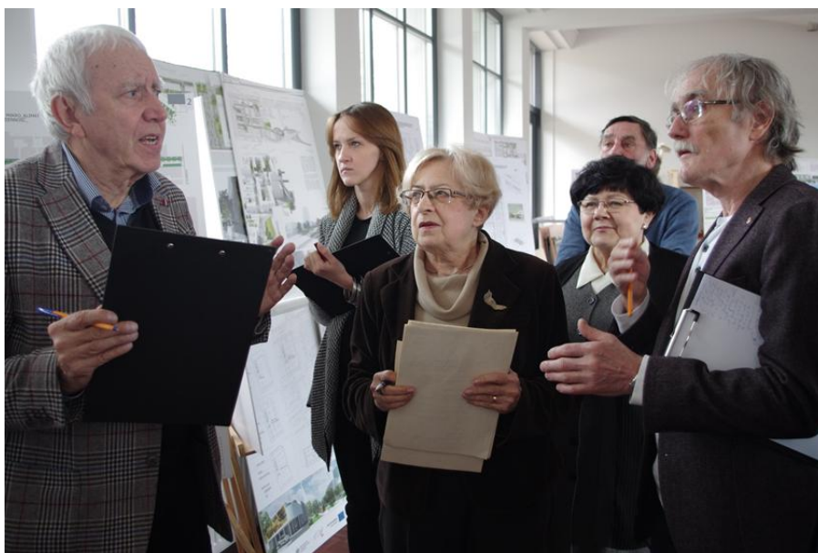
Foto: Dyskusja nad werdyktem.