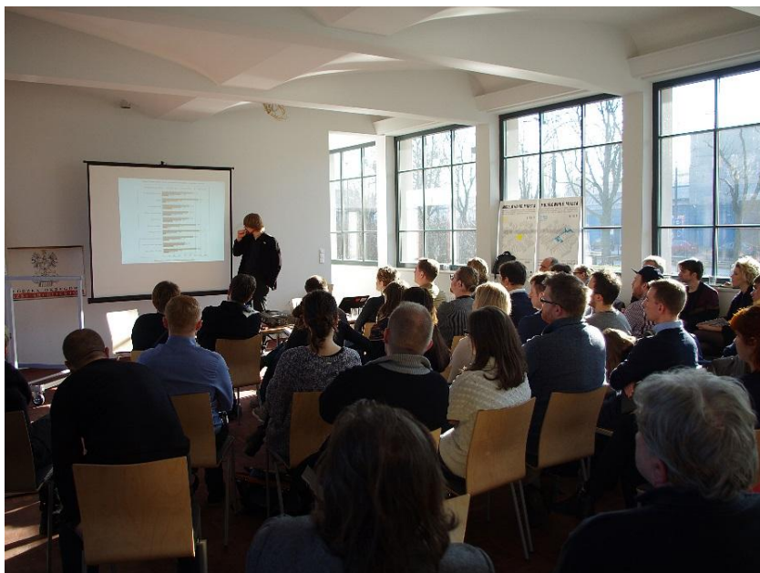
Foto: Wykład prowadzący