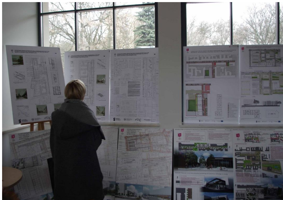
Foto: Wystaw prac konkursowych.

Wystawa pokonkursowa otwarta była przez cztery dni, w tym czasie można było zapoznać się szczegółowo ze wszystkimi pracami. Prace nagrodzone zostały opatrzone dodatkowym opisem. Na miejscu można też było wyrazić swoją opinię o pracach oraz wypowiedzieć się na temat przestrzeni publicznych w obszarze pilotażowym wypełniając przygotowaną ankietę dotyczącą odbioru przestrzeni publicznych w mieście w kontekście zaprezentowanych prac konkursowych. Rozwinięto w ten sposób partycypacyjny komponent konkursu.